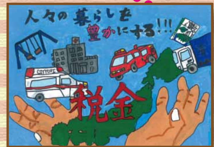
倉敷法人会 総社市立神在小学校6年