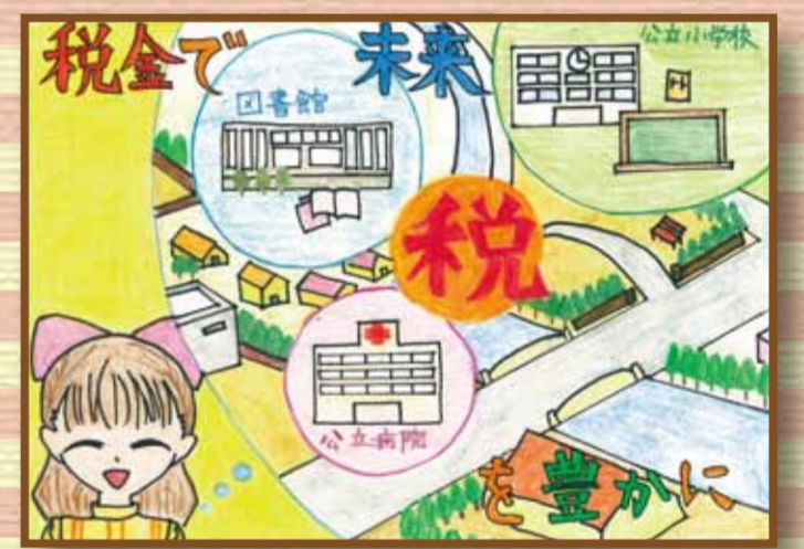
岡山東法人会 岡山市立竜之口小学校6年