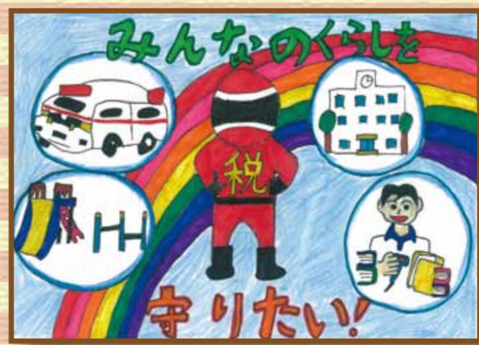
岡山西法人会 岡山市立第一藤田小学校6年