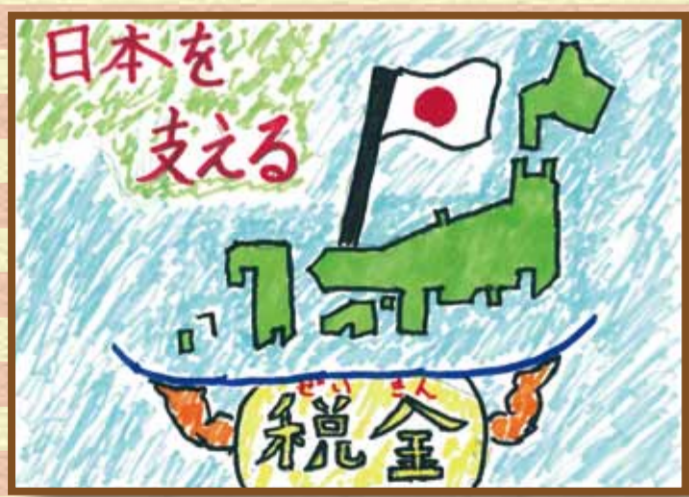
津山法人会 津山市立林田小学校6年