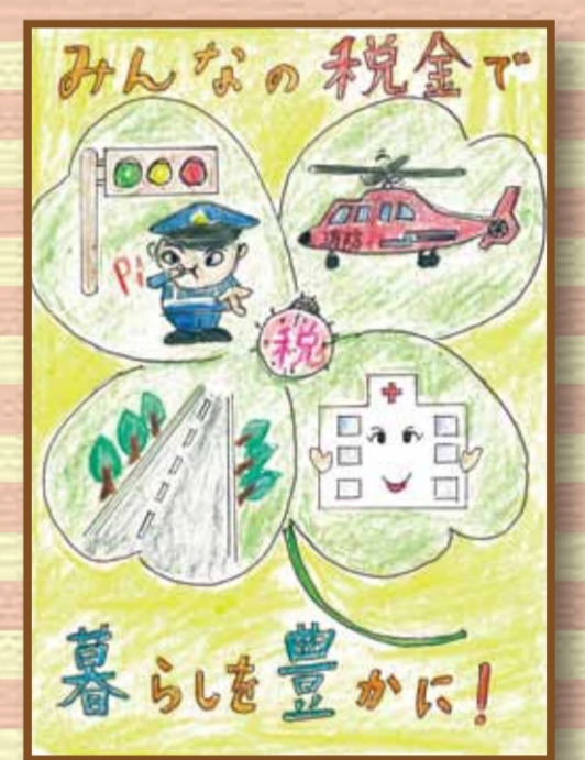
高梁法人会 高梁市立高梁小学校6年