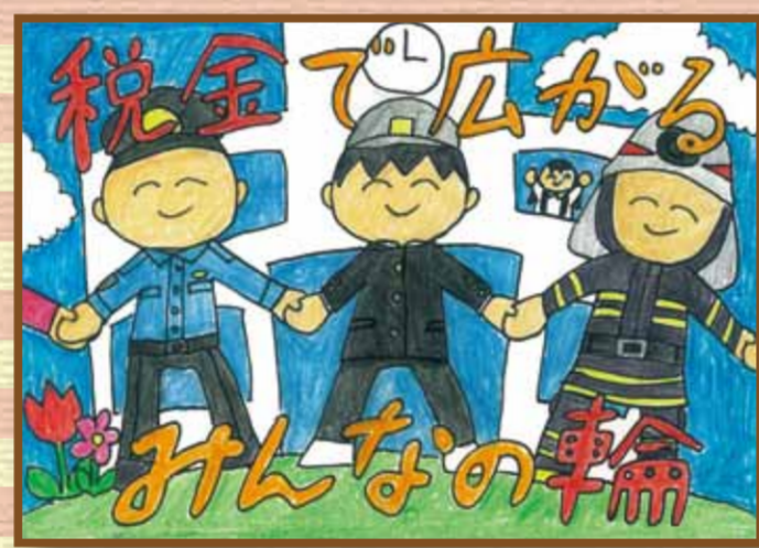
新見法人会 新見市立思誠小学校6年