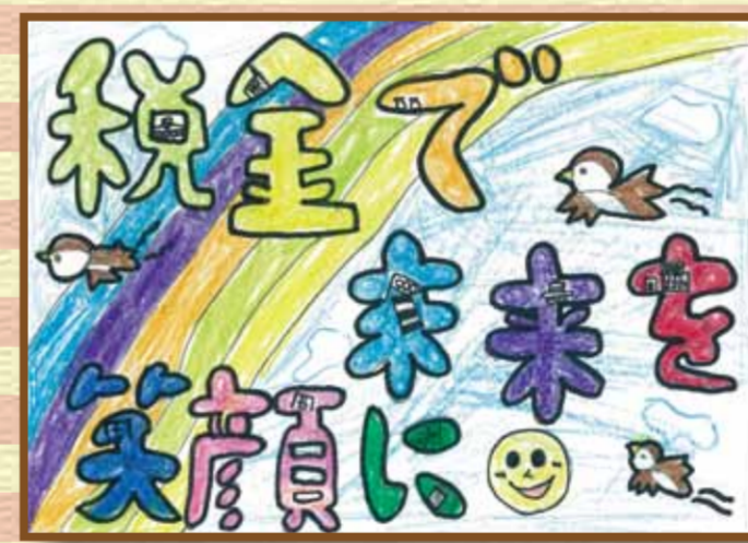
瀬戸法人会 備前市立日生東小学校6年