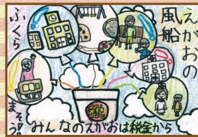
井笠法人会 笠岡市立中央小学校6年