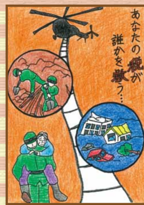
西大寺法人会 岡山市立西大寺小学校6年