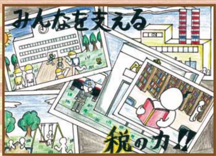
真庭法人会 真庭市立遷喬小学校6年