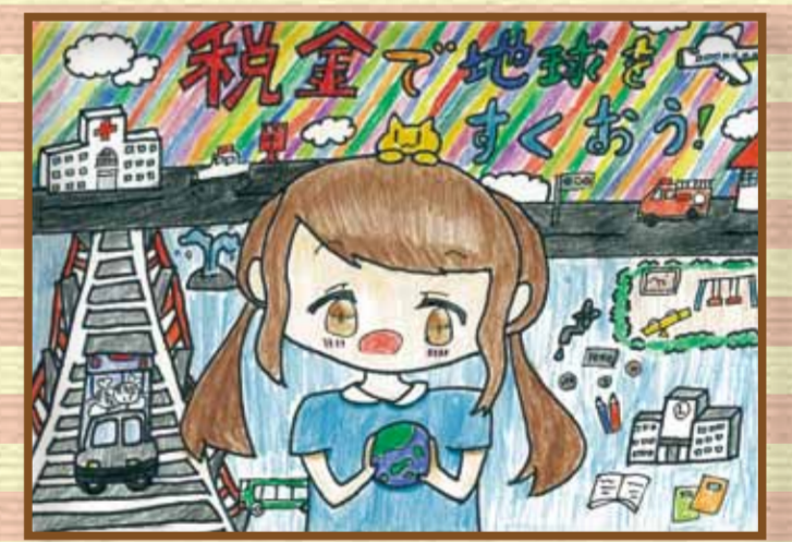
玉野法人会 玉野市立宇野小学校6年