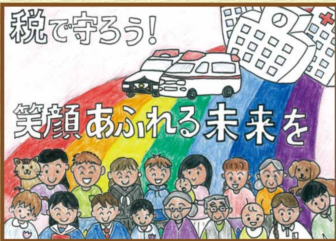
玉島法人会 里庄町立里庄東小学校6年